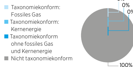
1. Taxonomiekonformität der Investitionen einschließlich Staatsanleihen*